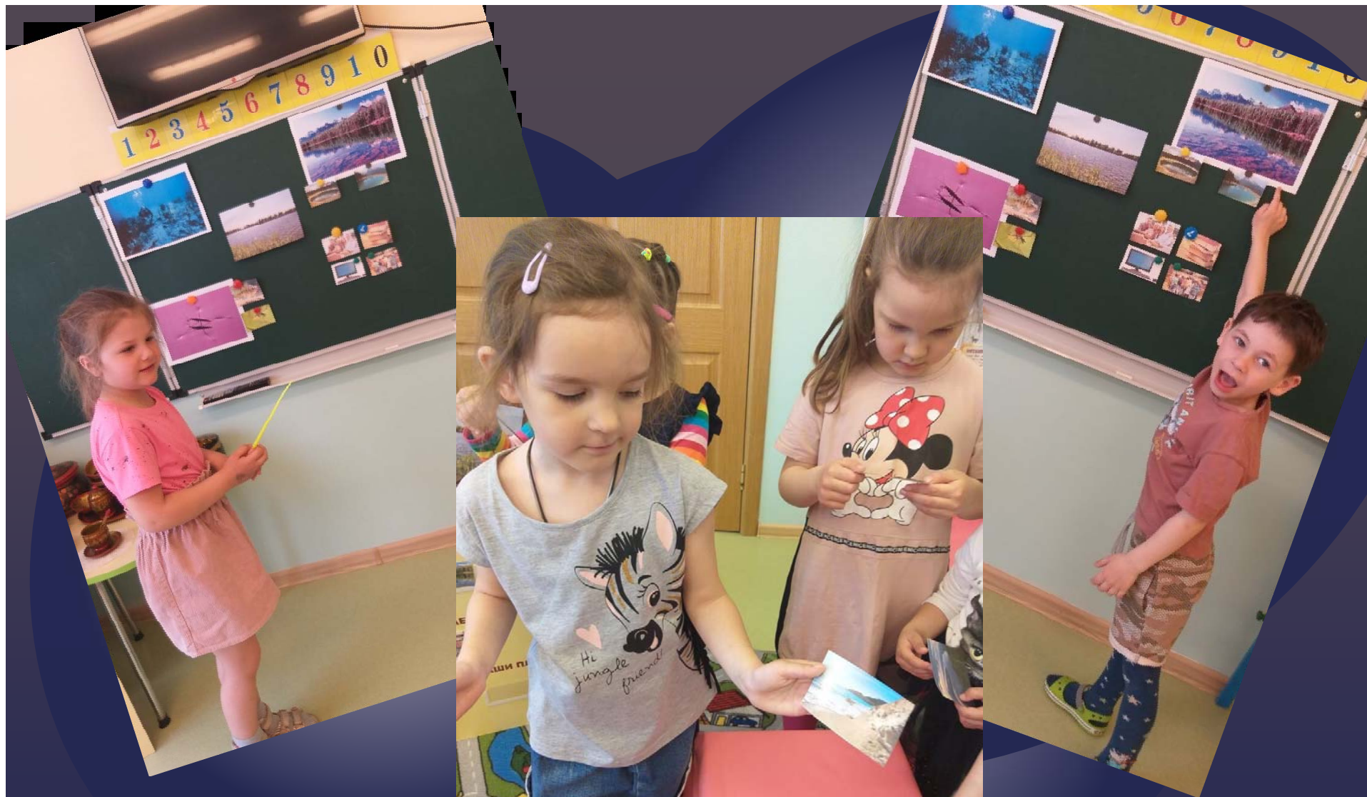
Описательные рассказы детей