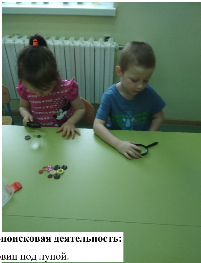
Экспериментально-поисковая деятельность: Рассматривание пуговиц под лупой.