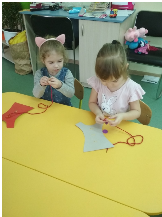
Д/И «Пришей пуговицу»